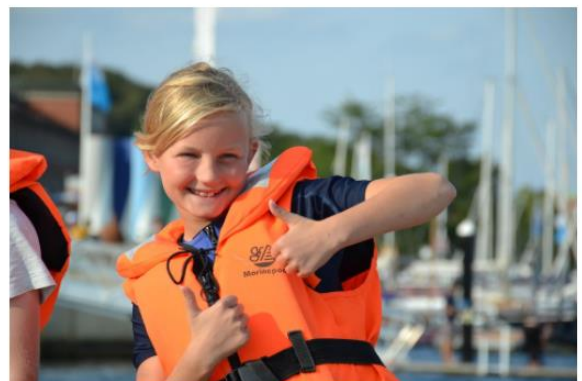
Abb. 1: Kursseite „Optisegelspaß für Anfänger*innen“ auf www.camp24-7.de